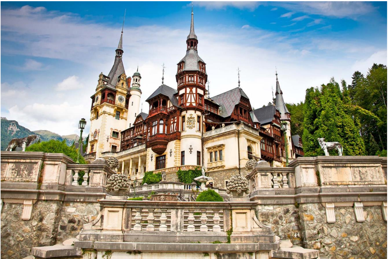
Château de Peles

(+ nuit la veille en hôtel 3*** à Paris CDG) Du Lundi 4 Juin au Mercredi 13 Juin 2018